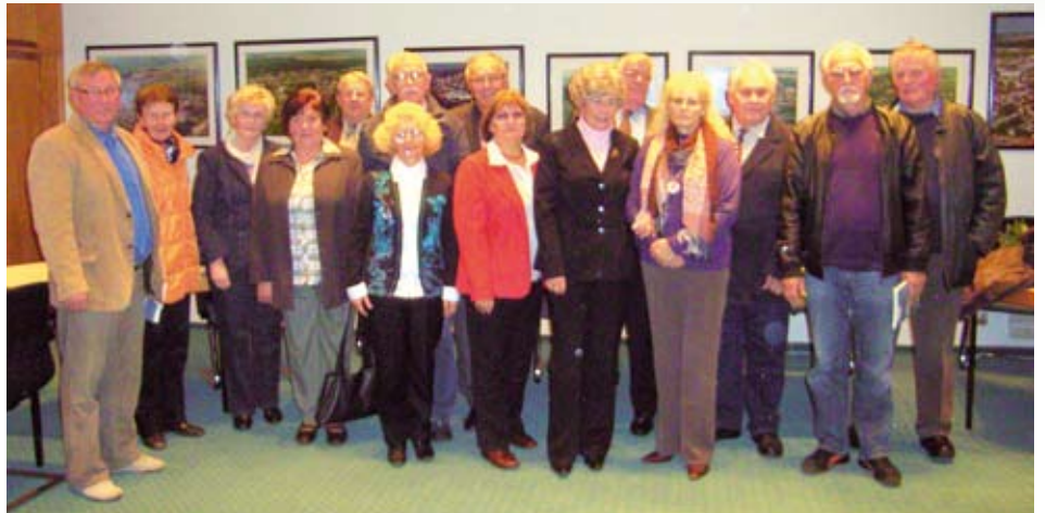
Mitglieder des neugewählten Seniorenbeirats