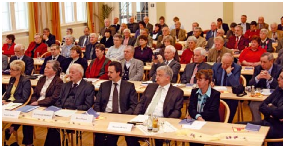
Teilnehmer der Festveranstaltung

Wie kann man denen helfen, die damit nicht zurecht kommen? Wie nutzen sie moderne Kommunikationsmittel? Welche Ansprüche haben sie an gesunde Ernährung? Wie wollen sie sich fit halten? Wie muss sich die Gesundheitsbranche auf die Vertreter einer gänzlich neuen (Un-)Ruhestandsgeneration einstellen? Welche Leistungen werden zusätzlich nötig und auch in Anspruch genommen?“