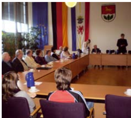
Gastredner Helmut Holter bei seinen Ausführungen

Die vierte Mitgliederversammlung des Kreissenorenbeirats Ludwigs-lust stand unter dem Motto „20 Jahre Mauerfall – 20 Jahre friedliche Revolution“. Daran nahm auch Helmut Holter, Fraktionsvorsitzender der Linken, teil. Als Zeitzeuge der Wende, als Bürger und Funktionär in der DDR sowie als Fraktionsvorsitzender der Linken im Landtag schilderte er sehr anschaulich seinen Werdegang, beginnend bei seiner Kindheit und Schulzeit in Malliß, über seine Studien in der DDR und der Sowjetuni-